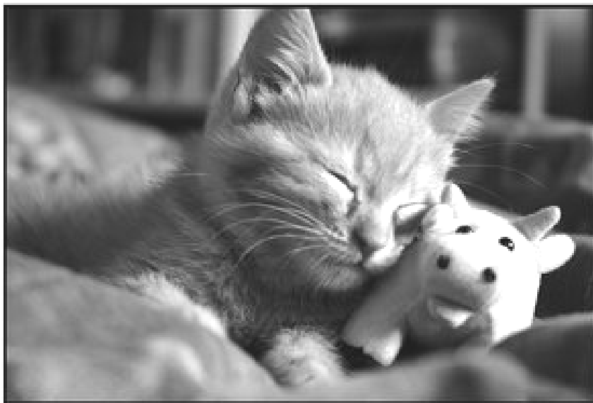
Terka, 6. ročník